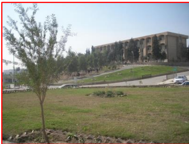
نغاية كانون الأول 2016